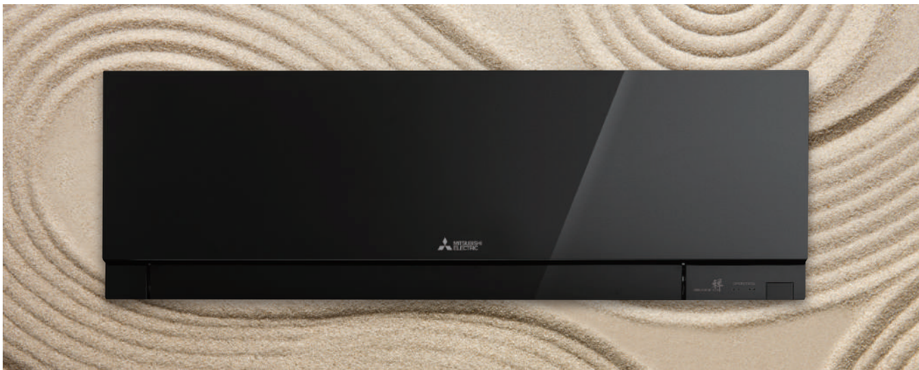
MSZ-EF VE(W/B/S) - Kirigamine Zen