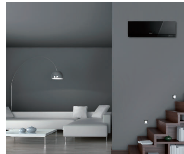
Modelo Mural Inverter

A Kirigamine Zen foi criada para proporcionar climatização de vanguarda e para ser um verdadeiro complemento decorativo de qualquer ambiente interior moderno.